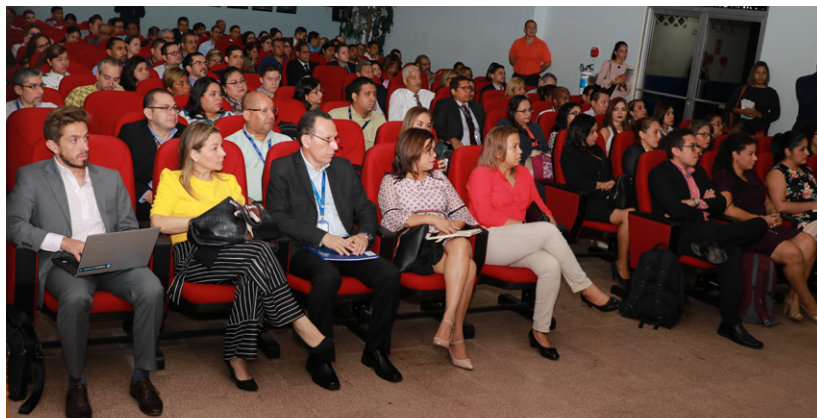
Capacitación a oficiales de información en temas de ética, datos abiertos y gobierno abierto.

La misión de este seminario fue resaltar la importancia de los Oficiales de Información de las instituciones públicas, en su rol de garantes de la transparencia, acceso a la información y ética pública de acuerdo a las funciones de la posición.