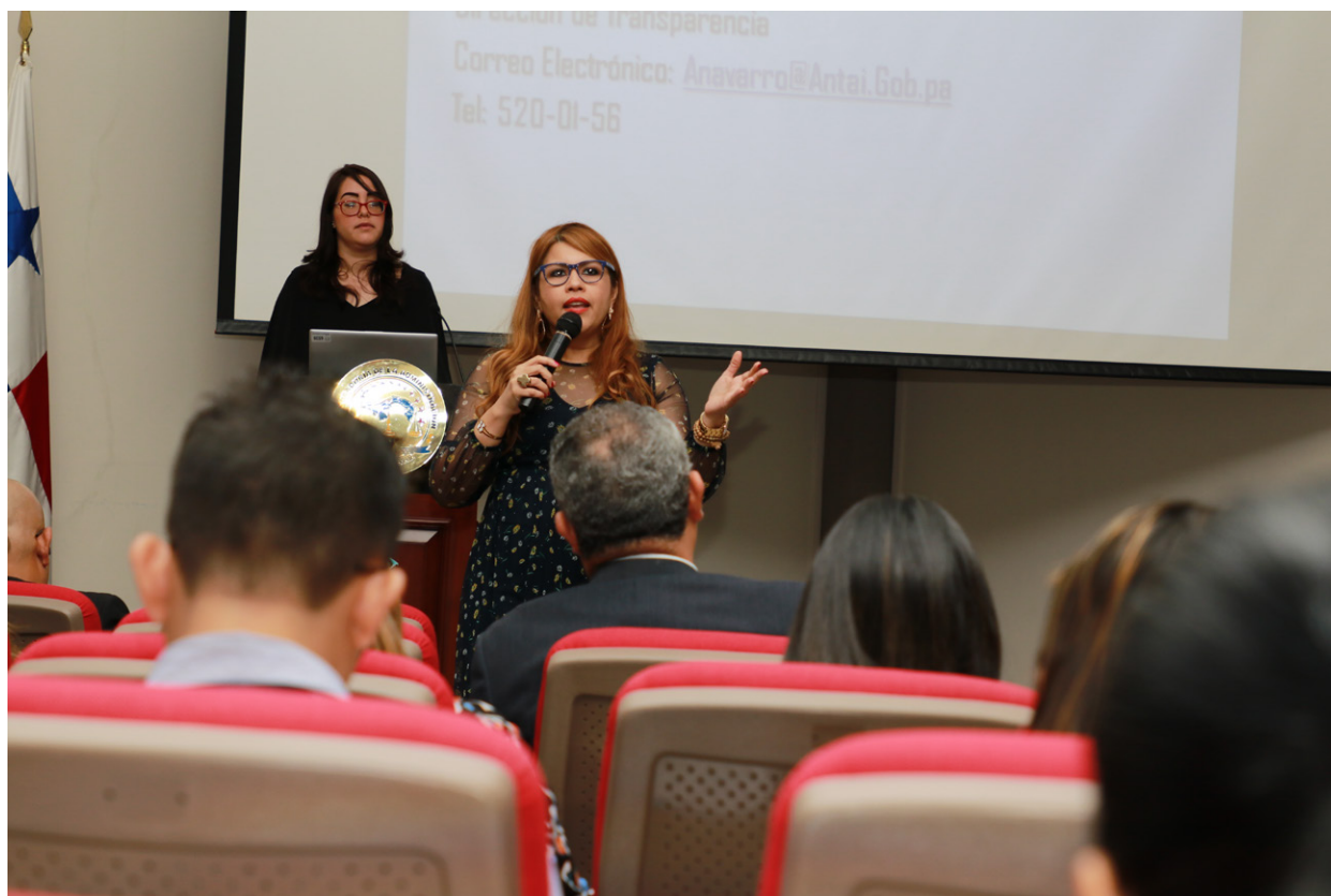
Capacitación a Oficiales de Información de las instituciones del Estado.

Esto permitirá que los Oficiales de Información demuestren mediante sus páginas webs, que cumplen con la Ley de Transparencia.