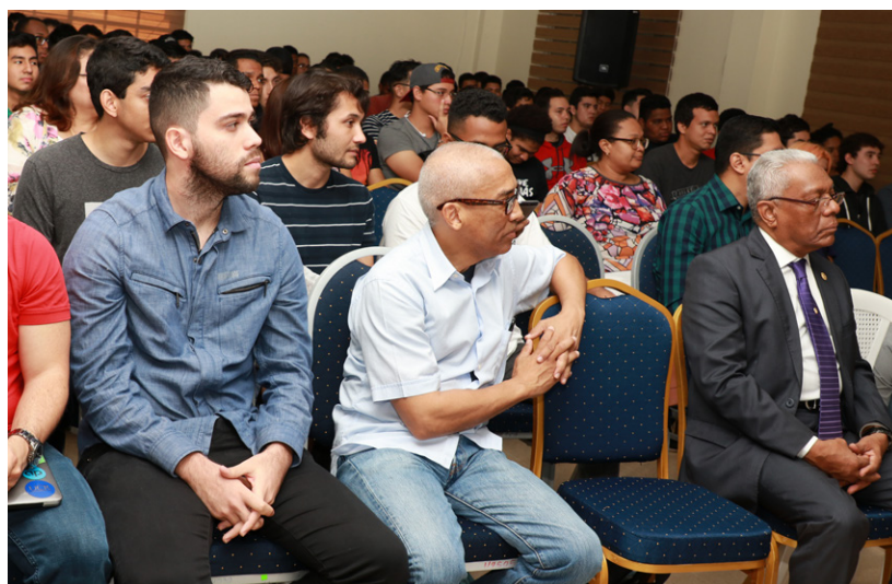
Estudiantes y público en general escuchan los objetivos de la Hackaton 2.0.

La Hackathon 2.0 se desarrolló en la UTP donde se convocó a desarrolladores, emprendedores y al público en general a participar en la generación de propuestas innovadoras, con el objetivo de resolver retos específicos basados en data real en un tiempo determinado.