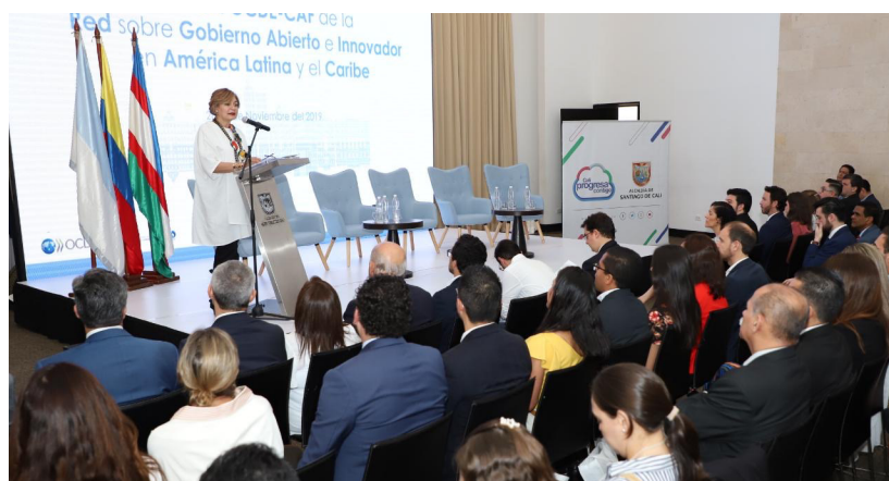
Reunión en la OCDE - CAF de Red sobre Gobierno Abierto innovador en América Latina y el Caribe

En el mes de noviembre se elaboró y se entregó el informe de autoevaluación del tercer plan de acción nacional de gobierno abierto para medir el cumplimiento de los compromisos de dicho plan. Adicional se llevó a cabo la evaluación de Mecanismo de Revisión Independiente (MRI) de la Alianza para el Gobierno Abierto, a cargo de realizar la evaluación independiente del tercer plan de acción nacional de gobierno abierto 2017-2019.