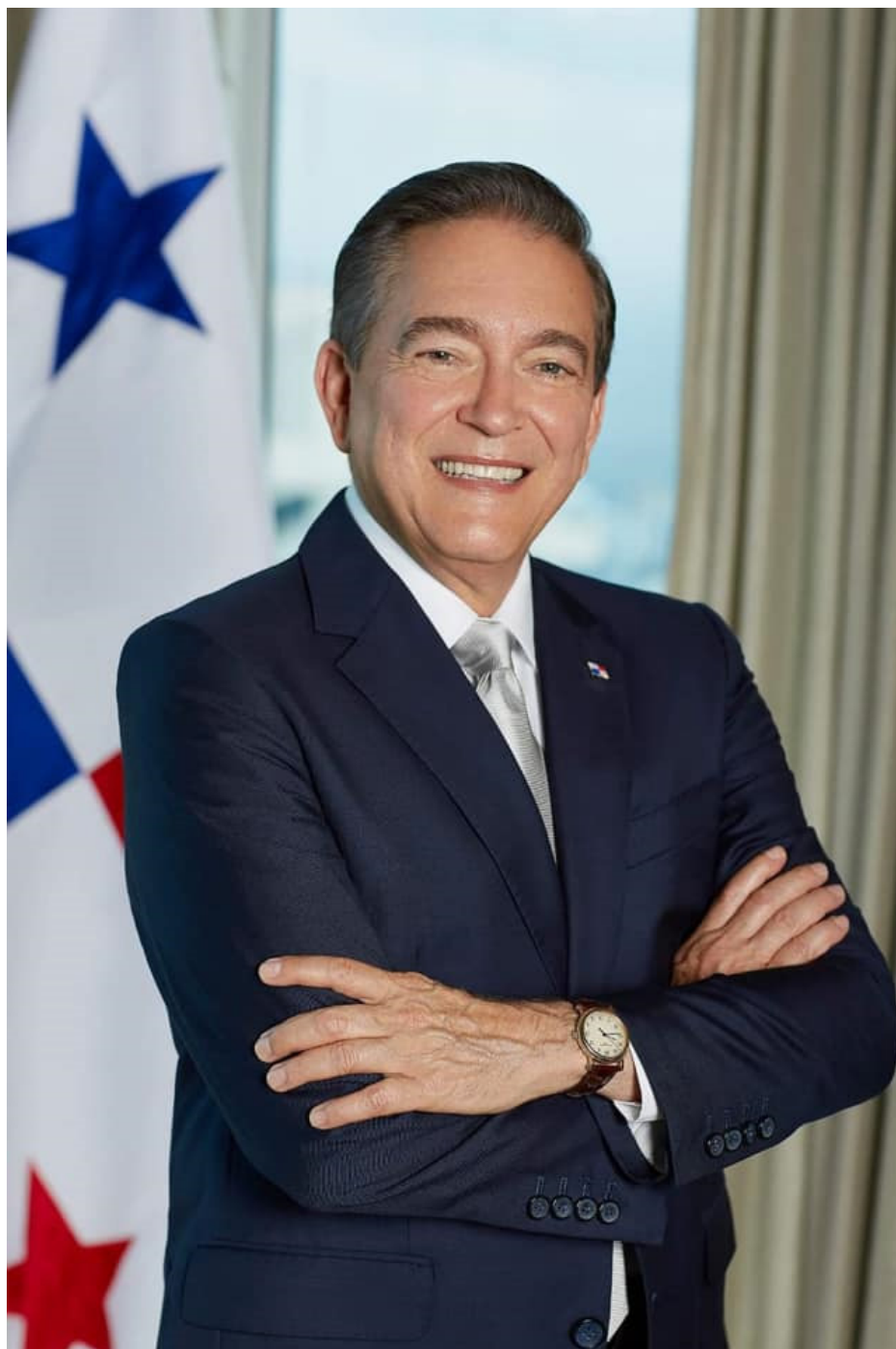
Excelentísimo Señor Laurentino Cortizo Cohen Presidente de la República de Panamá