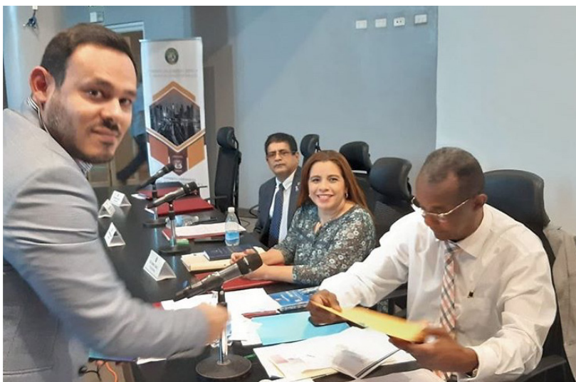
Presentación de propuestas de Reformas Constitucionales ante la Comisión de Gobierno de la Asamblea Nacional de Panamá.

Entre los casos relevantes, podemos señalar que está Autoridad mediante RESOLUCIÓN No. DS-008-19 de fecha 11 de Octubre de 2019, DECLARA el CIERRE del