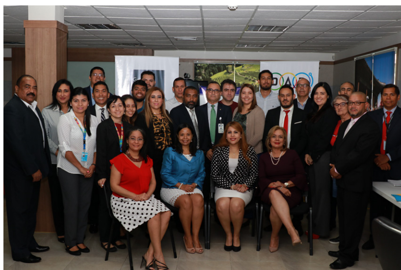
Participantes de las Mesas temáticas del 4º Plan de Acción.

Este acontecimiento fue dirigido, academias, sector privado, partidos políticos, innovadores y desarrolladores, gremios, ciudadanos independientes, organizaciones no gubernamentales, periodistas, estudiantes, público en general, con el objetivo de alcanzar mayor transparencia y rendición de cuentas en las instituciones públicas, mayor participación Ciudadana en la toma de decisiones gubernamentales,