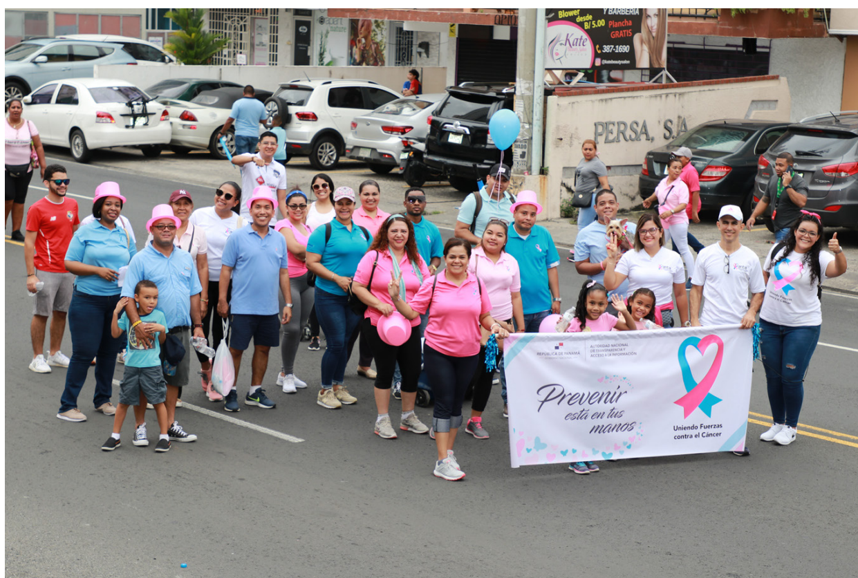
Servidores Públicos de la ANTAI participaron en la caminata "Uniendo Fuerzas contra el Cáncer" organizado por el Despacho de la Primera Dama.