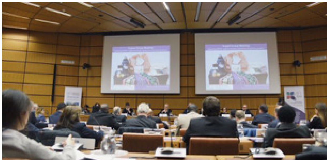
Conferencia de los Estados Partes.

Por último, se alentó a los Estados partes a que siguieran intercambiando información sobre buenas prácticas y enseñanzas extraídas en la formulación y aplicación de políticas y estrategias de lucha contra la corrupción.